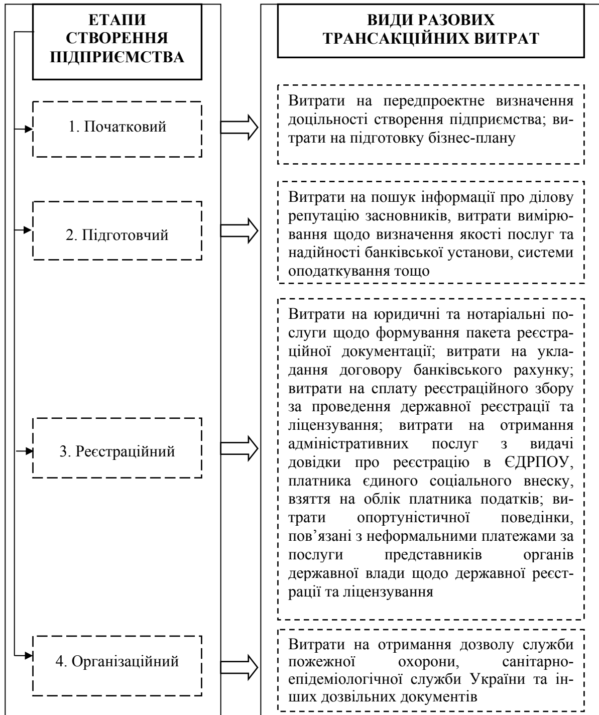
Рис. 1. Формування разових трансакційних витрат на різних етапах створення підприємства

блем фінансового забезпечення на місцевому рівні, зокрема бюджетного, кредитного та інвестиційного характеру. За таких умов стимулювання підприємницької активності задля підвищення конкурентоспроможності регіону можливе також шляхом дерегуляції господарської діяльності та ефективної взаємодії місцевих органів виконавчої влади з бізнес-структурами.