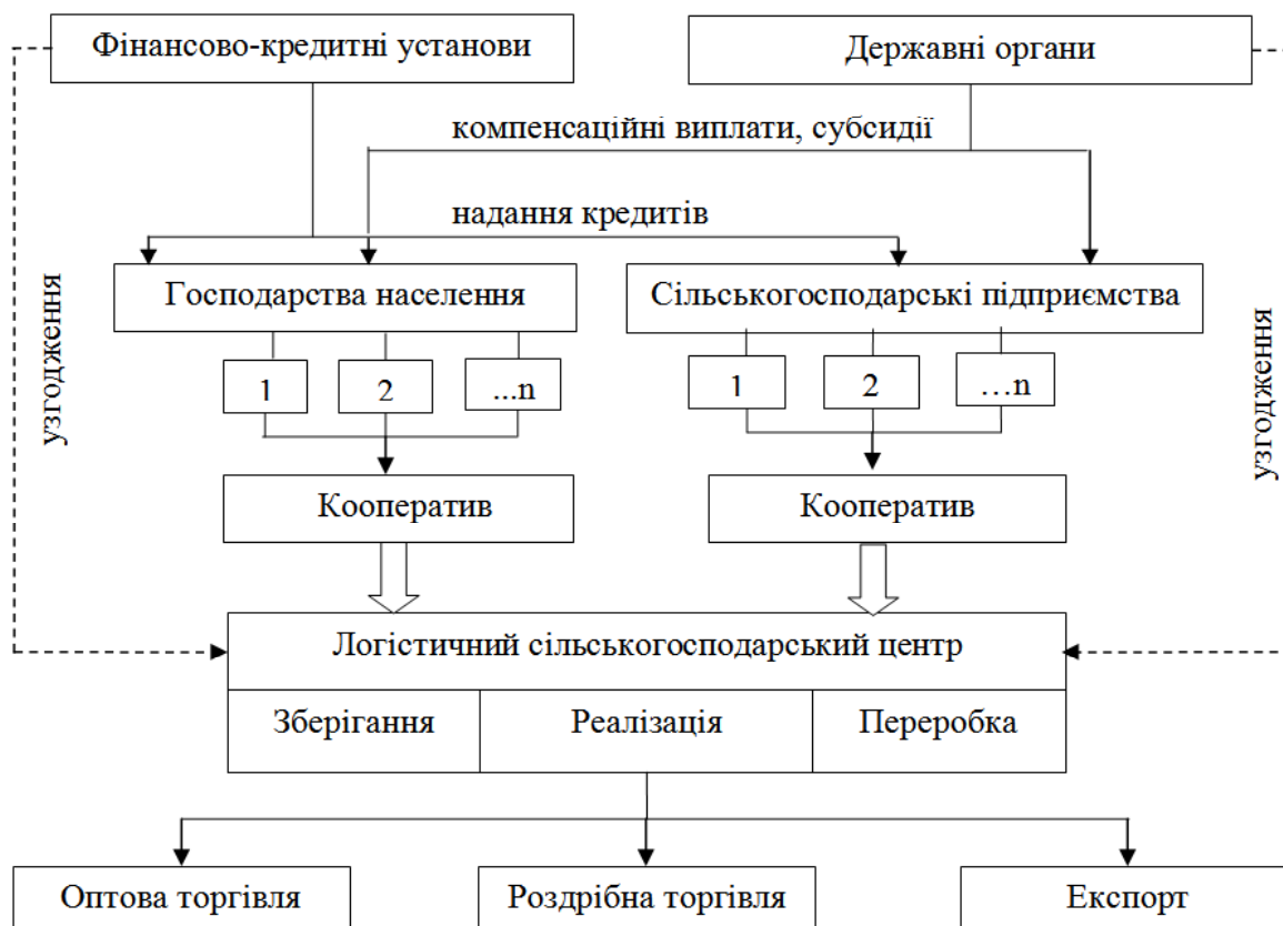
Рис.4. Модель функціонування логістичного центру

Сукупність зазначених факторів ще раз підкреслює необхідність створення ефективної системи зберігання і реалізації фруктів на основі положень збутової логістики, що спрямована на забезпечення раціоналізації процесу фізичного просування продукції безпосередньо від виробника до споживача.