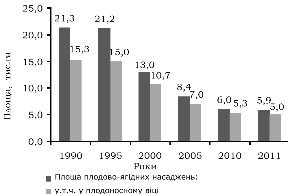
Рис.1. Динаміка площ плодово-ягідних насаджень у Миколаївській області

Виклад основного матеріалу. Миколаївщина, зважаючи на її територіальне розміщення, має сприятливі ґрунтово-кліматичні умови для садівництва. Однак, з переходом до ринкової економіки його стан значно погіршився, що насамперед позначилося на розмірах площ плодово-ягідних насаджень (рис.1).