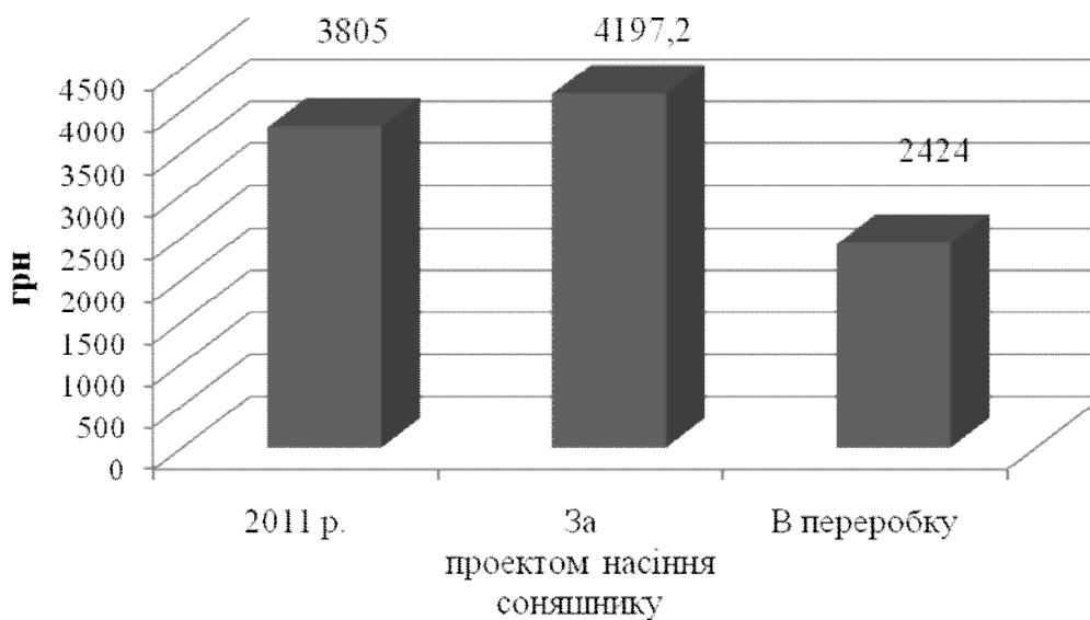
Рис. 1. Валові доходи від реалізації насіння соняшнику фактично та за проектом і соняшникової олії у СТОВ «Агрофірма «Україна» Врадіївського району

Наведені дані у табл. 1 та на рис. 1 свідчать, що реалізації соняшникової олії, яка буде вироблятися у господарстві на власній переробній лінії, є більш вигідною для підприємства, ніж реалізація тільки насіння соняшнику.